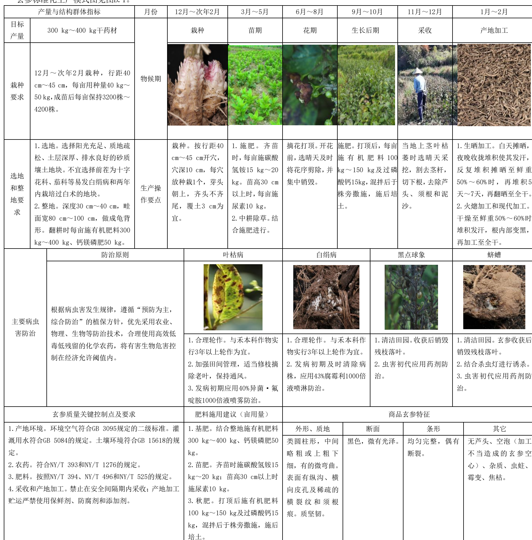
图B.1 玄参标准化生产模式图